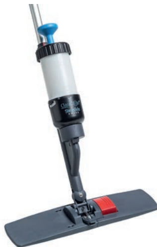
EASY CLEAN SYSTEM DRIZZ KLAPPHALTER 40 CM

Mit Klettthaltern 28, 40 oder 60 cm. Sprühkopf auf dem Halter. Bodennahe Befeuchtung. Einfachstes Handling. Art. 124924, 28 cm Drizz Set Art. 124922, 40 cm Drizz Set Art. 124920, 60 cm Drizz (kein Set!)