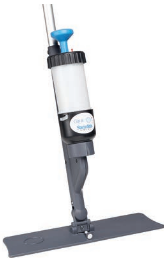
EASY CLEAN SYSTEM DRIZZ (SET) 28 / 40 / 60 CM

Mit Klettthaltern 28, 40 oder 60 cm. Sprühkopf auf dem Halter. Bodennahe Befeuchtung. Einfachstes Handling. Art. 124924, 28 cm Drizz Set Art. 124922, 40 cm Drizz Set Art. 124920, 60 cm Drizz (kein Set!)