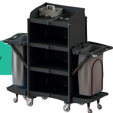
Art. BiG 506074