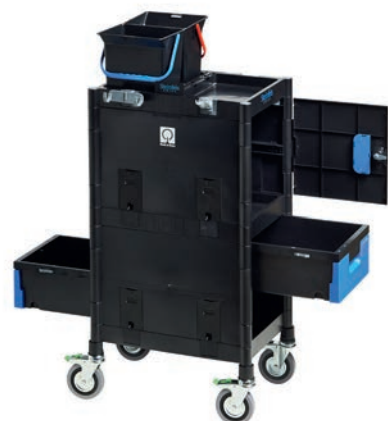
Art. BiG 506065