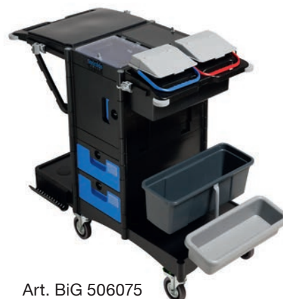
Art. BiG 506075